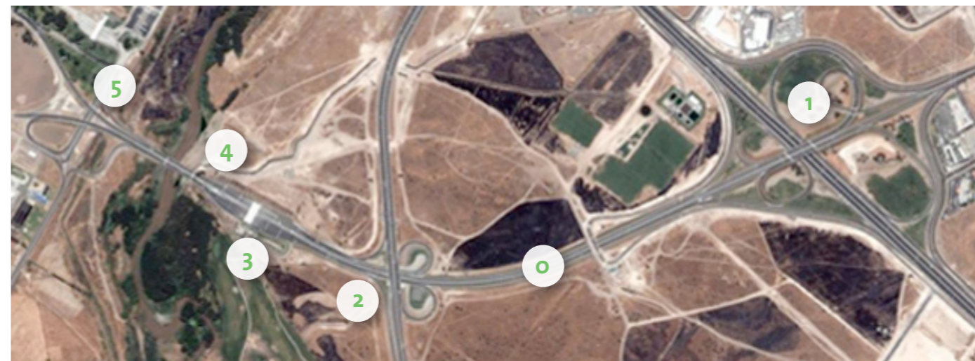
Ilustración de las Obras en Concesión - Acceso Sur

Área de Concesión - Acceso Sur: inicia en la Av. Américo Vespucio, en una intersección a desnivel ubicada al sur del río Mapocho, desde ahí se dirige al Aeropuerto Arturo Merino Benítez mediante un camino de doble calzada de aproximadamente dos kilómetros de longitud, denominado Acceso Vial Arturo Merino Benítez, cruzando en desnivel el Eje Oriente - Poniente de Costanera Norte sin incluir el enlace, el puente sobre el río Mapocho y finaliza en enlace vial inmediatamente después del mencionado puente incluyéndolo.